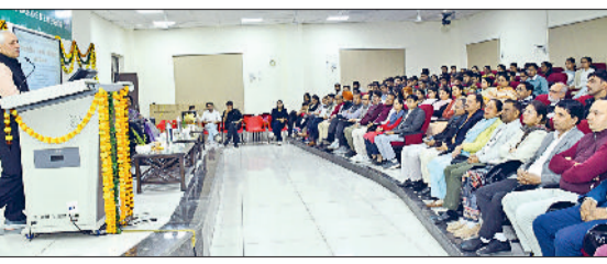
सिरसा। सम्मेलन को संबोधित करते वक्ता।