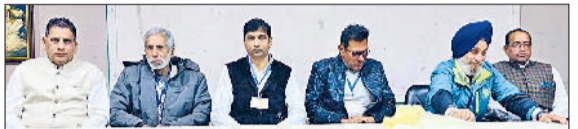
सिरसा। बैठक में भाग लेते आरएमपी।

■ सैकड़ों मेडिकल प्रैक्टिशनरों ने भाग लिया