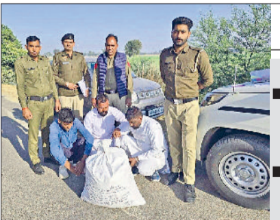
सिरसा। पकड़े गए चूरापोस्त तस्करी।

हरिभूमि न्यूज ▶▶ सिरसा पुलिस ने गांव खेरका क्षेत्र से कार सवार तीन नशा तस्करी के साठे तेरह किलोग्राम चूरापोस्त सहित गिरफ्तार किया है। सीआईए सिरसा प्रभारी ने मंगलवार को बताया कि पुलिस टीम एनएच-9 गांव खेरका से होते हुए गांव सहावणी की तरफ जा रही थी। इसी दौरान टी प्वाइंट सहावणी की तरफ एक कार आती दिखाई दी। कार में सवार युवकों ने सामने पुलिस की गाड़ी को देखकर अचानक कार को वापस मोड़कर वापस भागने का प्रयास किया। पुलिस ने शक के आधार पर कार सवार युवकों को काबू कर कार की तलाशी ली तो कार की डिग्री से एक प्लास्टिक का थैला बरामद हुआ। थैले की तलाशी ली तो 13 किलो 680 ग्राम डोडा चूरा पोस्त बरामद