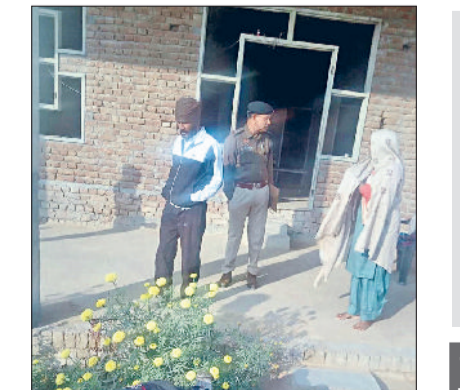
रतिया। गांव रत्ताखेड़ा में सर्च अभियान चलाते पुलिस कर्मचारी।