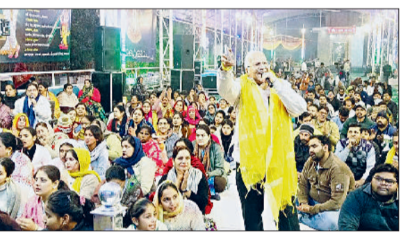
सिरसा। भजनों की प्रस्तुति देते हुए गायक।