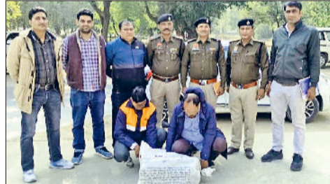
फतेहाबाद। नशीले कैप्सूल सहित पकड़े गए राजस्थान के दोनों युवक।