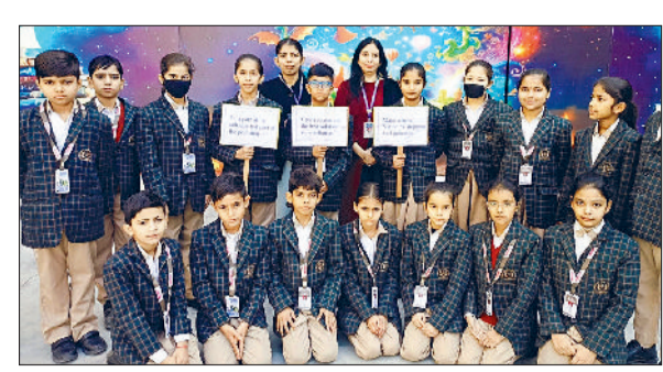
फतेहाबाद। क्रेसेंट स्कूल में राष्ट्रीय प्रदूषण नियंत्रण दिवस में भाग लेते विद्यार्थी।

सम्मेलन के उद्घाटन अवसर पर उपस्थित लोगों को संबोधित कर रहे थे। उन्होंने कहा कि विश्व स्तर पर भारतीय भाषाओं की बढ़ती स्वीकार्यता इस बात का प्रमाण है कि हमारी भाषाएं भविष्य का मार्ग प्रशस्त कर रही हैं। इससे समाज को गति भी मिल रही है।